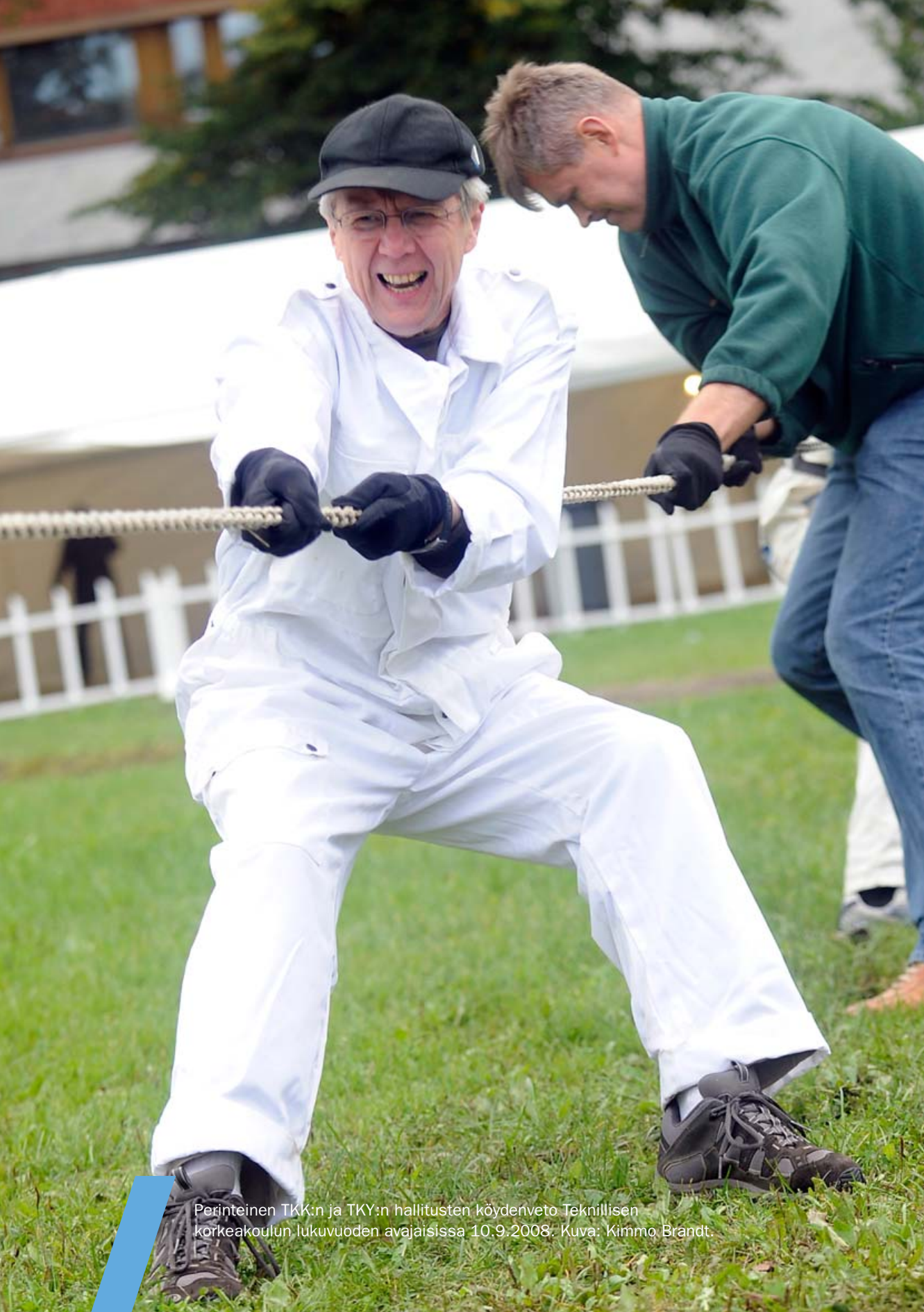
Perinteinen TKK:n ja TKY:n hallitusten köyden veto Teknillisen korkeakoulun lukuvuoden avajaisissa 10.9.2008.