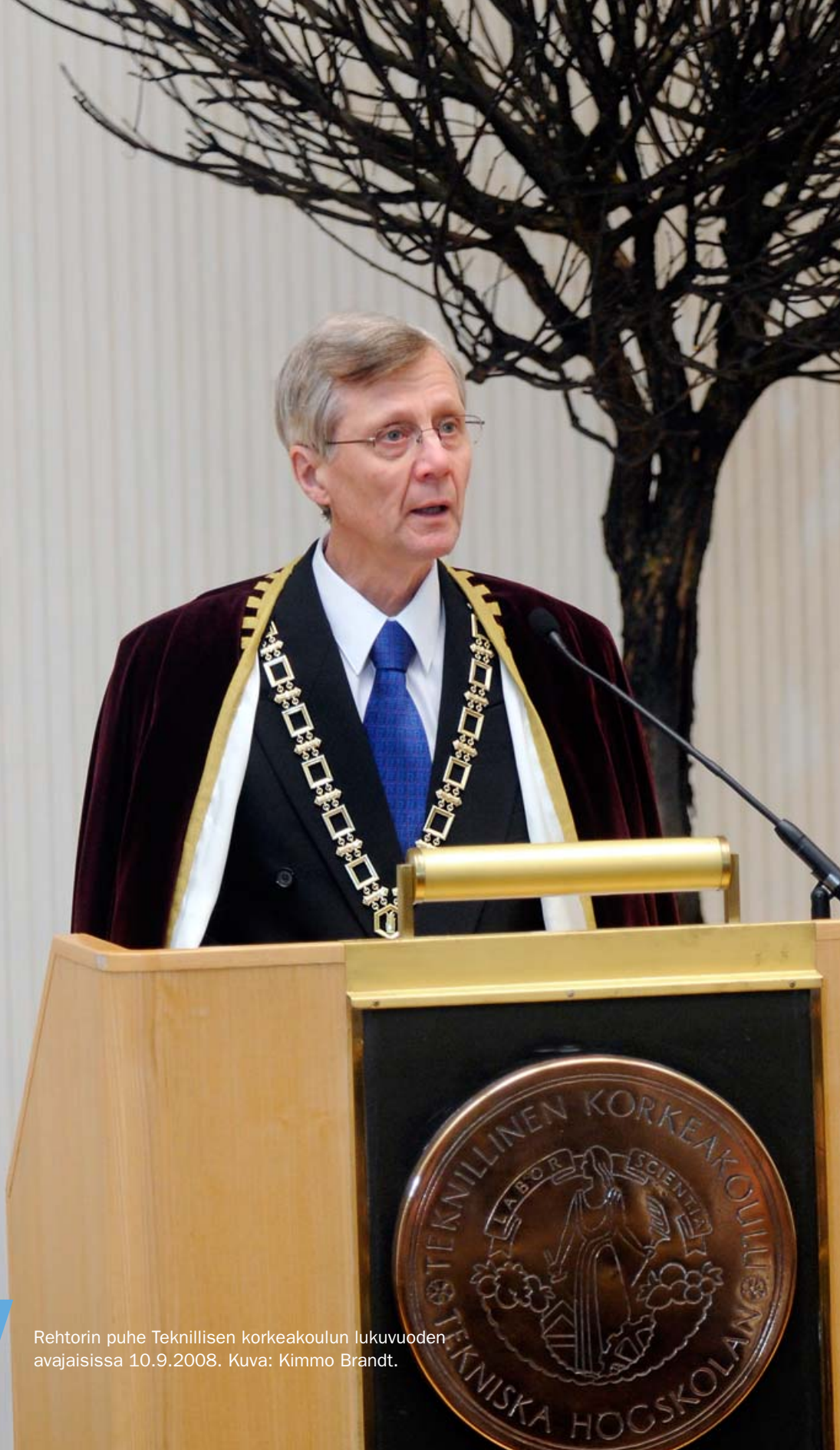
Rehtorin puhe Teknillisen korkeakoulun lukuvuoden avajaisissa 10.9.2008.