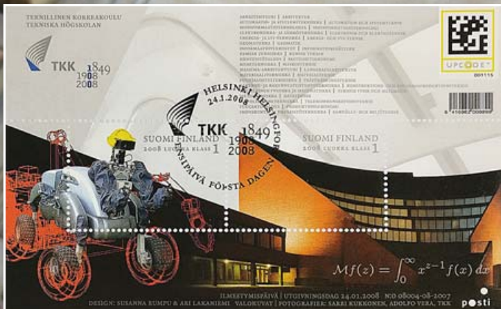
TKK:n päärakennuksen pienoismalli ja TTK sata vuotta yliopistona juhluvuoden postimerkki.